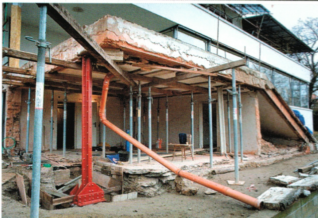
Abb. 1 und 2: Haus Tugendhat, Brno, Tschechien, Weltkulturerbe – nach und während der Sanierung 2010–2012.

im 20. Jahrhundert allzu schnell. – „GLOBALE“, die aktuelle Ausstellung im Zentrum für Kunst und Medientechnologie (ZKM) in Karlsruhe, analysiert das Jahrhundert der Moderne auf verschiedenen Ebenen und in spektakulärer Weise anhand einer Vielzahl von interessanten Forschungen und Themenstellungen. Sie erschließt im Laufe von 365 Tagen und in verschiedenen Workshops auf neue Weise beides, die sensationellen Innovationen und die katastrophalen Fehlentwicklungen, und stellt erneut Fragen.